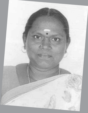
சு. தமிழரசி அரசு தொடக்கப் பள்ளி, தானம்பாளையம்

முந்தைய பள்ளியின் பெயர்: அரசு தொடக்கப் பள்ளி புதுக்குப்பம் (அ) ஆசிரியர்கள்: 3 மாணவர்களின் எண்ணிக்கை: 17