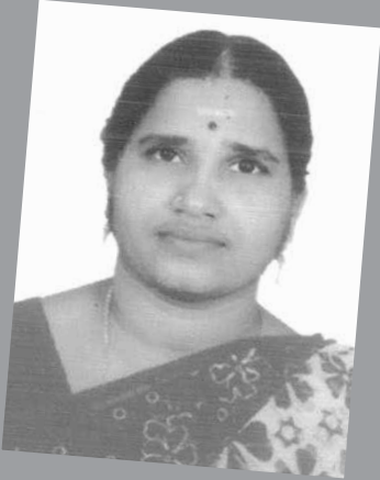
வ. சுமதி அரசு தொடக்கப் பள்ளி, அரியாங்குப்பம் பேட் ஆசிரியர்கள்: 2 மாணவர்களின் எண்ணிக்கை: 23

முந்தைய பள்ளியின் பெயர்: அரசு தொடக்கப் பள்ளி புதுக்குப்பம் (அ) ஆசிரியர்கள்: 3 மாணவர்களின் எண்ணிக்கை: 17